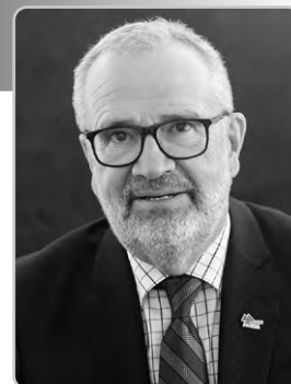
Camil Turmel, maire